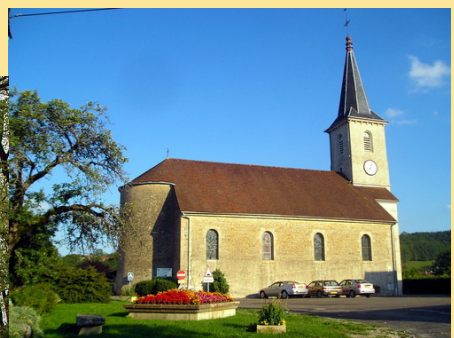
Eglise Saint André à Augisey Paroisse Notre Dame de Vaucluse