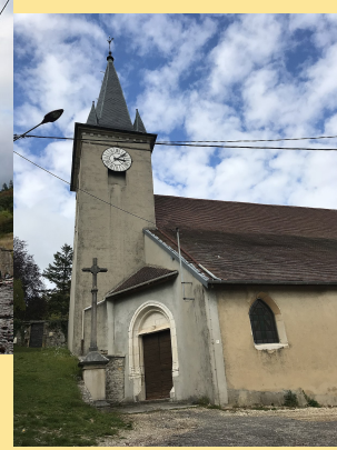
Eglise Sainte Catherine à Montfleur Paroisse de Val Suran