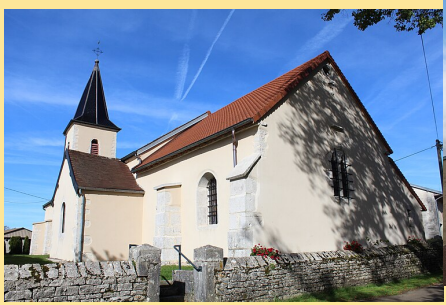
Eglise Saints Pierre et Paul à Charnod Paroisse St J-Marie Vianney