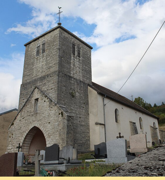
Eglise Saint Pierre-ès- Liens à Légna Paroisse Notre Dame de la Petite Montagne