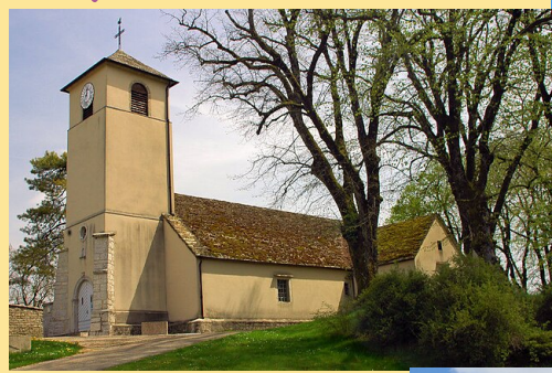
Eglise Saint Nicolas à Pully Paroisse des Lauzes