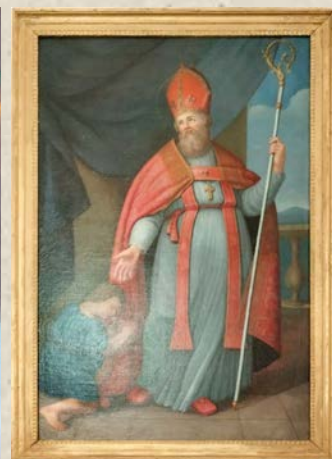
Saint Claude, saint patron de notre diocèse

Rendez-vous dans le n° 194 pour vous parler de Saint Claude