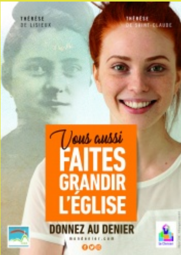
Denier de l'Eglise 2025 (Page 6)