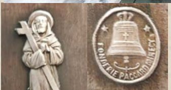
← Les détails